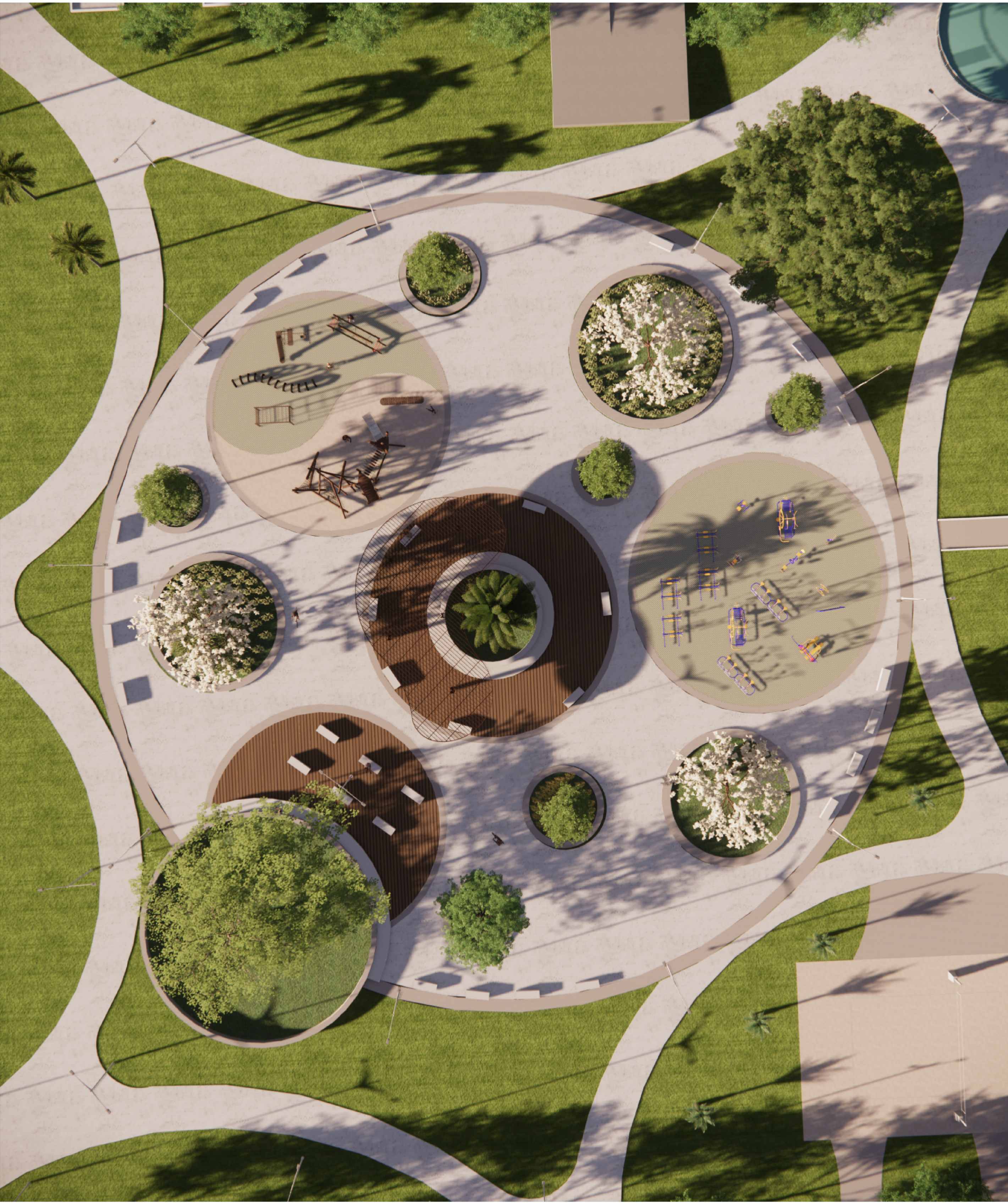
REFERENCIA DE PROJEÇÃO DA PAGINAÇÃO EXECUTADA